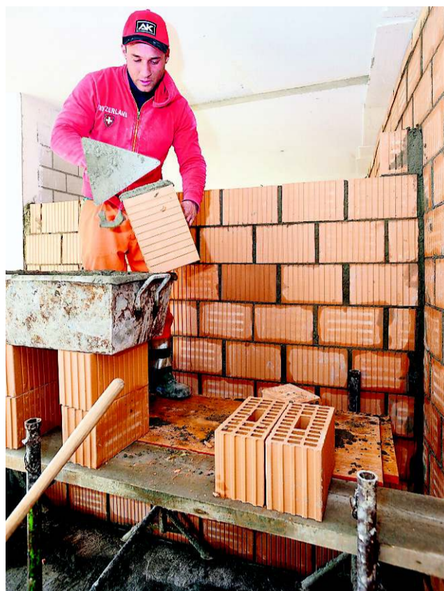
Die Mauer nimmt Gestalt an.