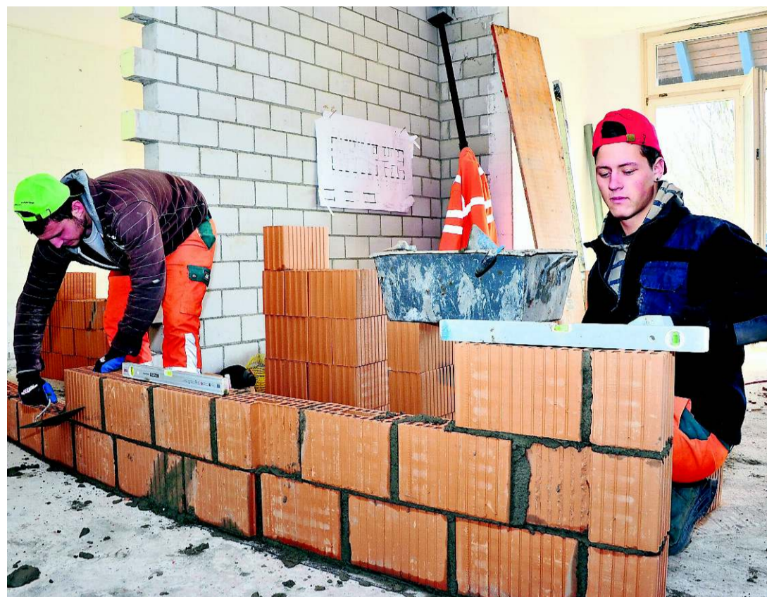
Exaktes Mauern und Nachprüfen erfordert viel Konzentration.